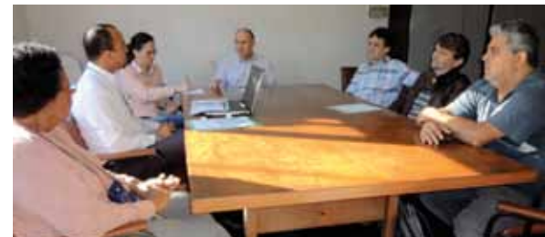
Comissão de seis associados foi nomeada para estudar o reajuste anual da UNIMED. A primeira reunião ocorreu em 18/06/14.