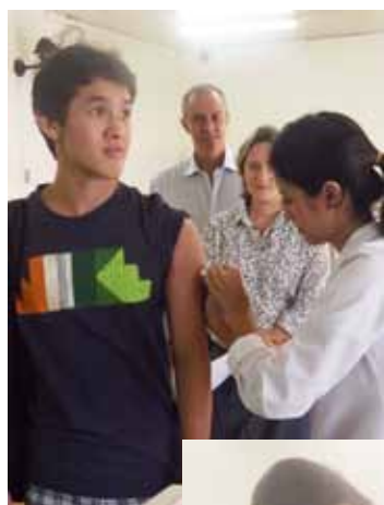
II Campanha de Vacinação Antigripal (03 a 04 de abril)